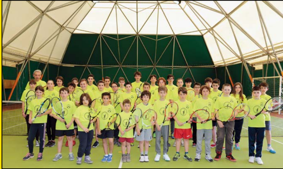
I ragazzi partecipanti alla Scuola 2016 dell'A.S.D. Tennis Fagagna